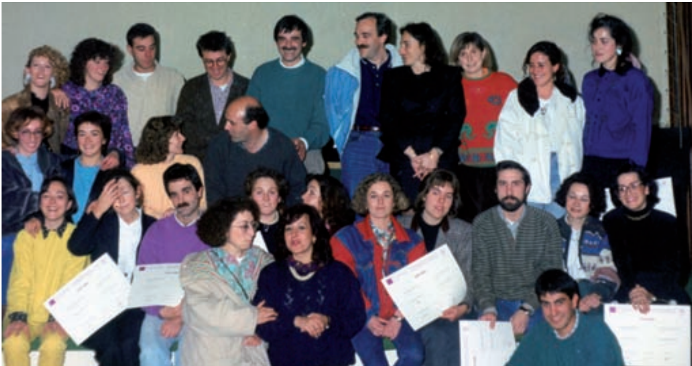
UNEDeko Psikomotrizitate Eskolaren lehen promozioiko ikasleak eta irakasleak, norbere diplomarekin.

ten dute, eta lankidetzaz jorratzen dute Asefopen barruan dauden beste herrialdeetako eskolekin. Halaber, prestakuntza modulo berri bat zabaldu zuten 2005ean, zailtasunak dituzten haurrekin lan egiteko psikomotrizitate laguntzako.