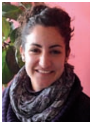
Miren LOINAZ GARATE URTXINTXA ESKOLA

Lerro horien bidez, euskararen normalizazioan helburua zein den irudikatu dezakegu: hizkuntza erabilgarria izatea. Istorio horretako tabernan bezala, guk ere, inguruko taberna eta beste toki guztietan, euskara ahotik ahora axolagabeki ibiltzea nahiko genuke.